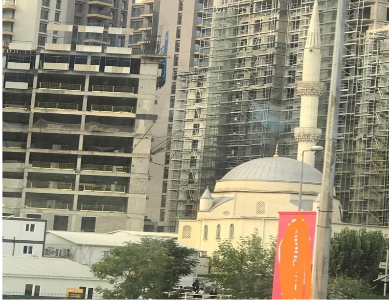
Fotoğraf 4, MA: Peygamber’in fethini müjdelediği şehirden bir görüntü.

nasıl kötü olabilir? İslam coğrafyası Dünya’da değil midir? Dünya’da bir yer? Dünya içinde bir yer. Kötü zamanda olduğumuz bir söylenti değil, gerçekse bu geçmiş ile geleceğin arasına sıkışmış olanların kötü zamanı mıdır? Tüm bu sıkılmışlığa rağmen, birileri, aynı yerde olanlardan birileri sürekli hayaletlerini bir gölge gibi yanlarında taşıyarak hakikate giydirdikleri bembeyaz çarşaflarıyla hiç de kötülükle özdeşleştirmiyorlar kendilerini. Dünyayı kurtaracaklarını söylüyorlar. Dünyanın kurtarılmasına hem de her şeyin kötü gittiği bir yerden başlamak makul görülebilir. Kabe’nin tepesindeki hayalet için “Bina dünyanın en yüksek binaları arasında yerini alması bekleniyor”, diyorlar. Kabe’nin tam tepesinde yer alan bu taş, Kabe’nin mezar taşı niyetiyle inşa edilmiş olabilir mi?